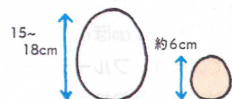
ダチョウの卵 ニワトリの卵

ダチョウの卵ひとつで、ニワトリの卵20個分以上もの大きさです。おいしく食べられますが、殻はかなづちでないと割れないほど硬く、食べるのに一苦労です。